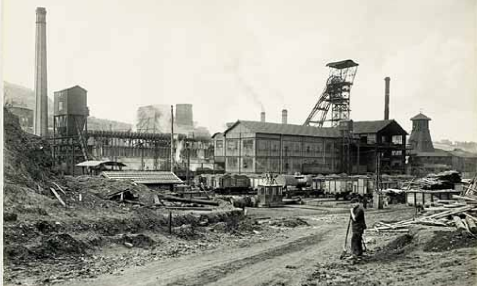
Couriot en mars 1922