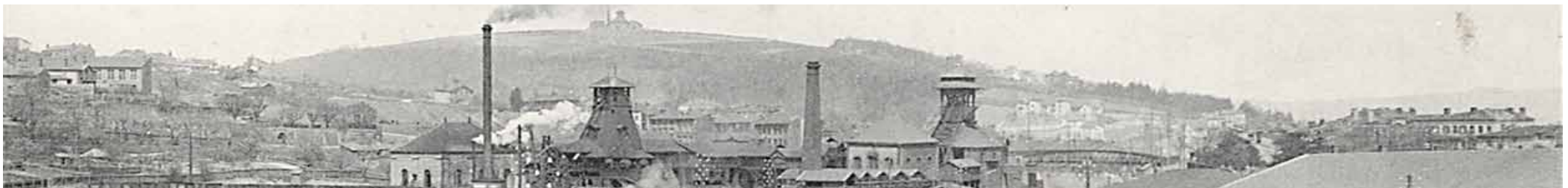
Les puits Chatelus vers 1905

Sur le site Couriot, il y a eu des puits dès le milieu du XIX e siècle et jusqu'en 1973 . Entre ces deux époques, le paysage a beaucoup changé !